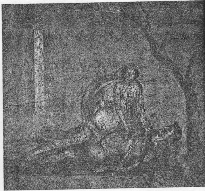
Πύραμος και Θίσβη. Τοιχογραφία ρωμαϊκής εποχής από την Πομπηία (Νεάπολη, Εθνικό Αρχαιολογικό Μουσείο).

Κατά την επικρατέστερη εκδοχή (Οβίδιος, Μεταμορφώσεις 4, 55-166), ο Πύραμος και η Θίσβη από τη Βαβυλώνα αντιμετώπισαν την άρνηση των γονέων τους να εγκρίνουν το γάμο τους, εξαιτίας παλιάς διαμάχης που χώριζε τις οικογένειές τους και έτσι αποφάσισαν να παντρευτούν κρυφά, φεύγοντας μακριά. Κατά τη διήγηση, οι εραστές όρισαν συνάντηση έξω από την πόλη, κοντά στον τάφο του Νίνου*, δίπλα σε μια πηγή, όπου φύτρωναν μουριές. Εκεί έφτασε πρώτη η Θίσβη, η οποία βρέθηκε αντιμετώπιση με μια λέαινα και στην προσπάθειά της να ξεφύγει έχασε τον πέπλο της, που ξεσχίστηκε και ματώθηκε από τα δόντια του θηρίου, ενώ η ίδια κατόρθωσε να κρυφτεί πίσω από ένα θάμνο. Όταν έφτασε και ο Πύραμος και ανακάλυψε το σχισμένο πέπλο, νόμισε ότι η αγαπημένη του είχε κατασπαραχθεί και μέσα στη βαθιά απελπισία του αυτοκτόνησε με το ξίφος του, όμως λίγες στιγμές προτού ξεψυχίσει, εμφανίστηκε η Θίσβη, η οποία, αδυνατώντας ν' αντέξει το θάνατό του, τον ακολούθησε, χρησιμοποιώντας κι