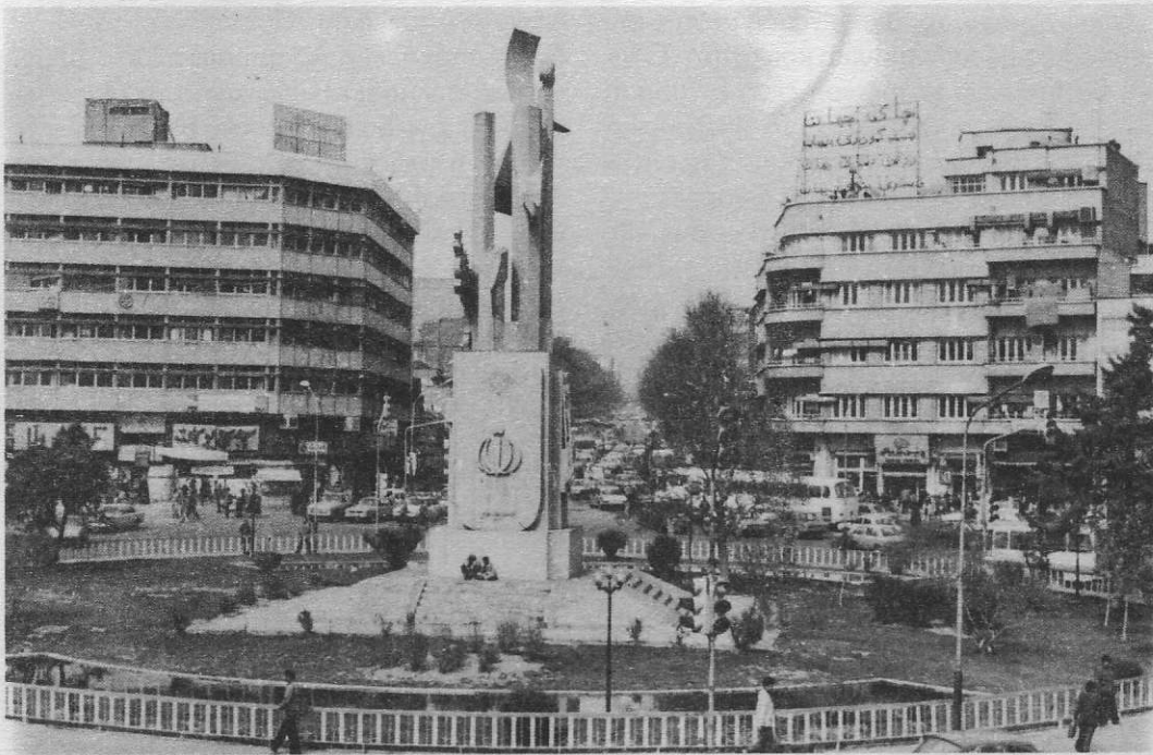
Πλατεία 'Επανάστασης ('Ενγκελαντ) Τεχεράνη.