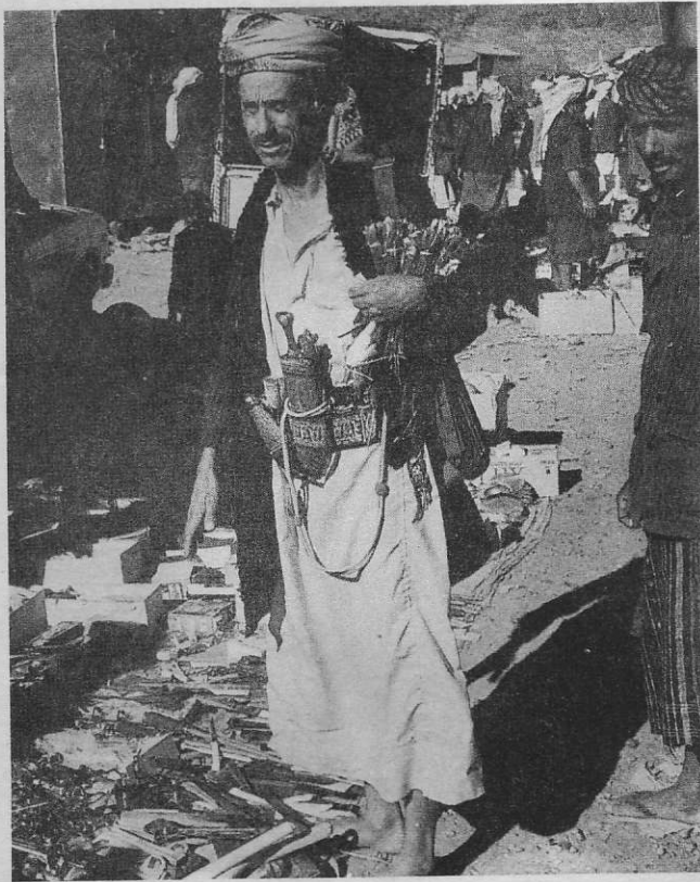
Σκηνές από Παζάρι.