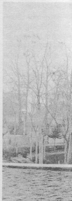
Ὁ τάφος τοῦ Ἀβικέννα

Πολλά πείθουν γιὰ τό συνεχές ρωσικό-σοβιετικό ἐνδιαφέρον γιὰ τὴν περιοχή. Ἡ Ρωσία εἶχε προξενεῖο στήν Οὐρουμίγιε (:ἡ «μὴ ἑλληνική» πόλη), πρωτεύουσα ἀκριβῶς τῆς σημερινῆς ἐπαρχίας Δυτικοῦ Ἀτζερμπαϊτζάν, πρὶν ἀπὸ τὸν Α' Παγκόσμιο Πόλεμο. Μέσω τοῦ προξενείου αὐτοῦ προωθοῦσε τὰ ἴδια αὐτά σχέδια κάτω ἀπὸ τό οἰκτρό προσωπεῖο τῶν δῆθεν διαχριστιανικῶν ὑποστηρίξεων καί συνεργασιῶν, χρησιμοποιώντας τούς ἐκεῖ ἐγκαταστημένους καί πολυαριθμώτερους ἀπὸ σήμερα «Ἀσσύριοις» νεστοριανούς. Ἡ ρωσική προώθηση ἄλλωστε στόν Α' Παγκόσμιο Πόλεμο μέσα στήν ὀθωμανική αὐτοκρατορία δέν πῆρε κατεύθυνση πρὸς τὰ νευραλγικά δυτικά σημεία (Ἐρζερούμ - Σεβαστεία - Καισάρεια) ἀλλὰ πρὸς νότο (λίμνη Βάν) μέ στόχο τό σημερινό βόρειο Ἰράκ (Μοσούλη). Ἡ σοβιετική προώθηση στόν Β' Π.Π. καί κατά-